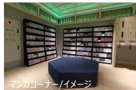
マンガコーナー/イメージ