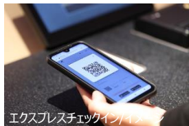
エクスプレスチェックイン/イメージ