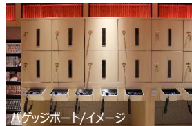
バゲッジポート/イメージ